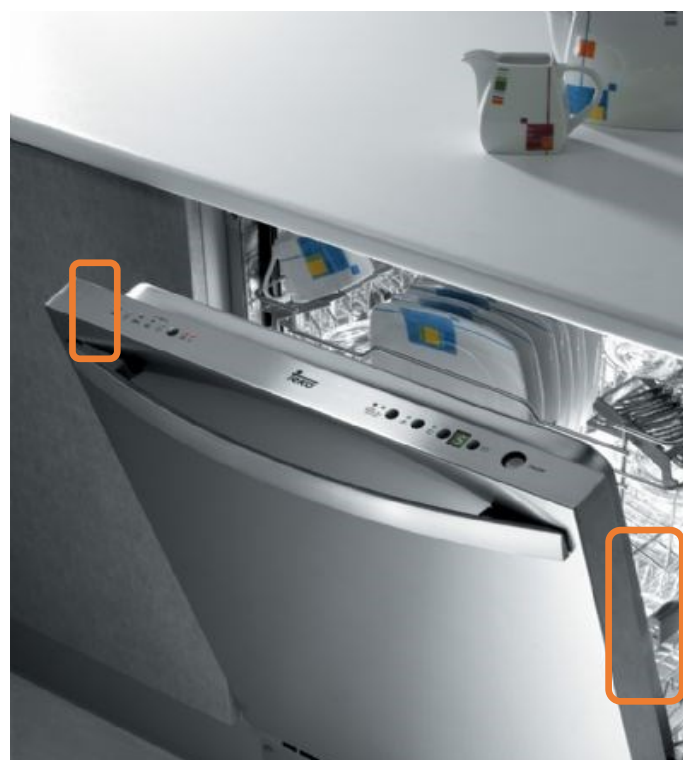
DW8 80 FI